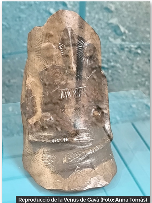
Reproducció de la Venus de Gavà

En el interior de la mina es varen trobar evidències de les diverses activitats que també es dedicaven en aquesta època neolítica, com l'agricultura, la ramaderia, mostren que no només es dedicaven a la mineria com puntes de fletxa, molins de mà, fulles d'aixada i de destrat i dents de falç, i presència de plantes i restes d'arbres que formaven l'entorn del poblat. També explotaven recursos