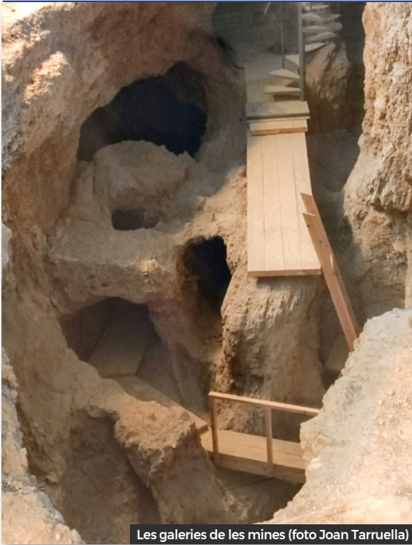
Les galeries de les mines

animals amb finalitats alimentàries. Els cultius eren principalment d'ordi, blat i de lleguminoses