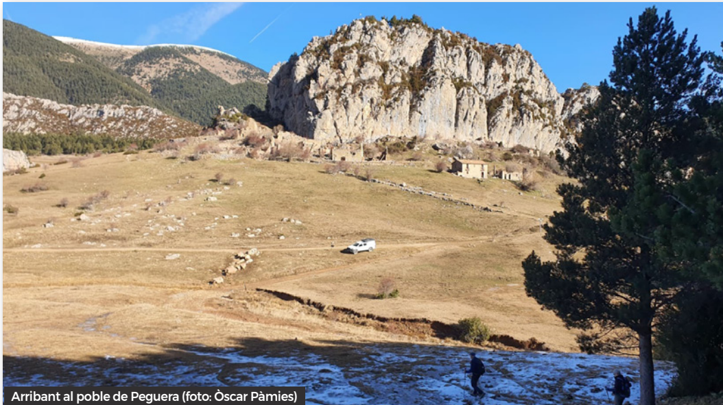
Arribant al poble de Peguera

Pràcticament fem tot el desnivell de baixada en aquest espectacular bosc fins tornar a creuar el torrent de Peguera ja ben a prop de Sant Jordi de Cercs, on finalitzem l'excursió.