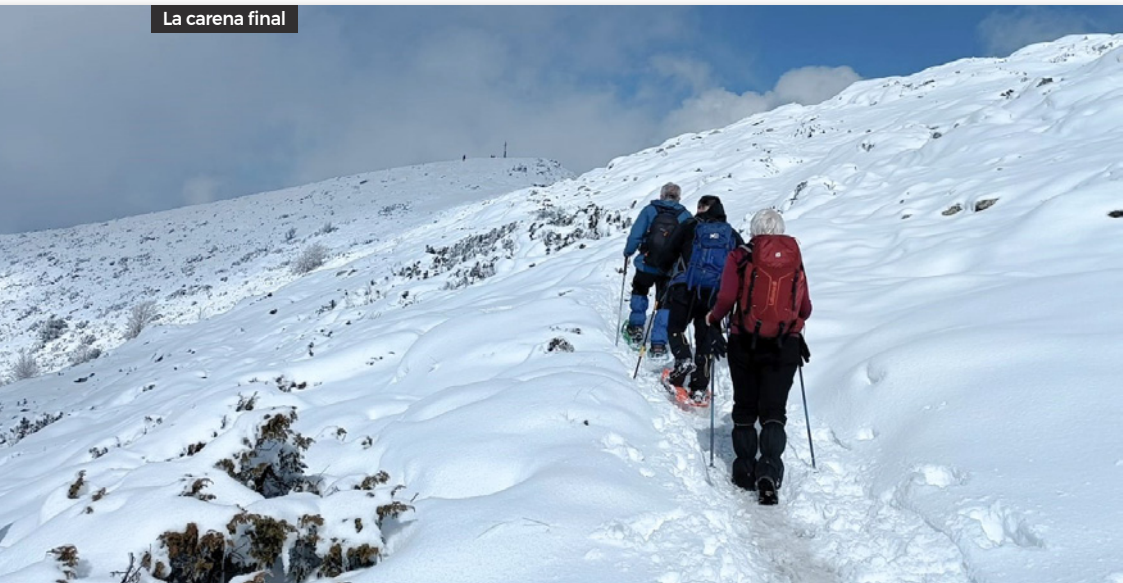
La carena final