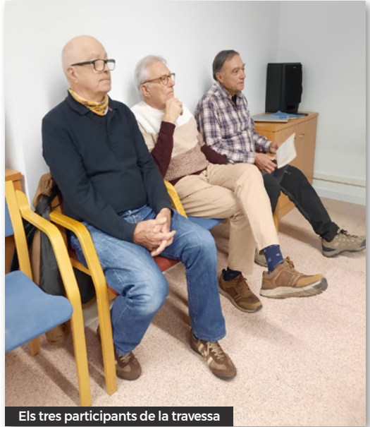
Els tres participants de la travessa

Un cop fet aquest resum es va projectar la pel·lícula que es va gravar