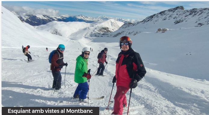
Esquiament amb vistes al Montblanc

Ha estat una setmana espectacular i que esperem poder-la repetir un altre any.