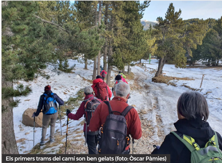
Els primers trams del camí son ben gelats

els diferents trams que seguien les antigues vagonetes. El corriol, a trams ben protegit, passa molta estona per unes extenses fagedes, i quan ha de canviar de pla, baixa en bones llaçades fins el següent.