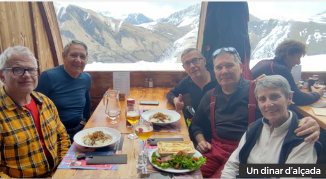
Un dinar d'alçada

Ski Vintage es un grup de WhatsApp, pensat per comunicar-nos tots els que, malgrat que ja tenim una edat, ens agrada anar a esquiar i el millor de tot: ho podem fer entre setmana!!