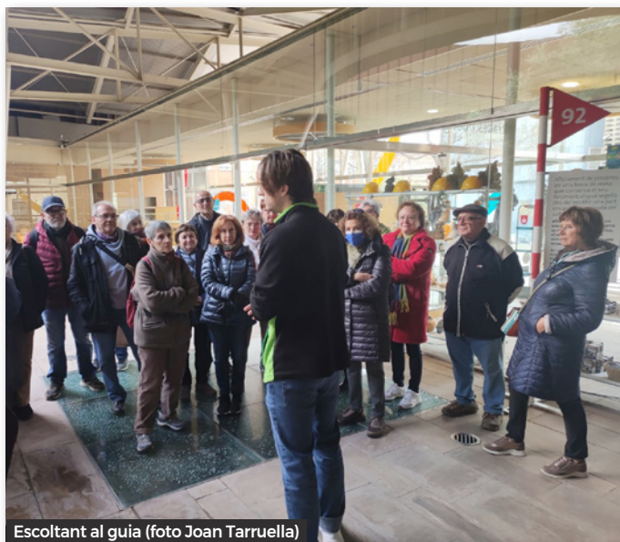
Escoltant al guia

De la variscita en feien ornaments corporals com collarets, braçalets de nombre variable de peces. L'explotació minera de Gavà mostra no només un consum local sinó que la producció estava dirigida sobretot al consum extern. Els intercanvis també portaren objectes i idees.