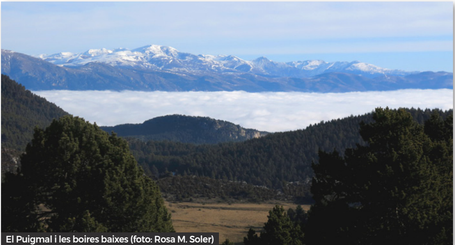
El Puigmal i les boires baixes

Comentem la història d'aquest petit poble situat a 1640 metres d'alçada i que havia arribat a tenir 174 habitants. A finals del segle XIX es van obrir tres mines de carbó que foren explotades fins a 1928. La darrera casa es va abandonar el 1968. Fill de Peguera, fou el darrer maquis català, en Ramon Vila conegut com "Caracremada". Fa pocs anys va com-