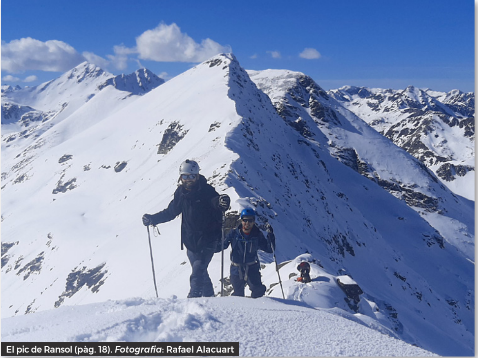
El pic de Ransol (pàg. 18).