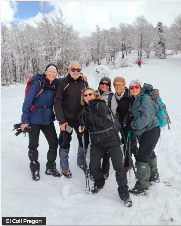
El Coll Pregon