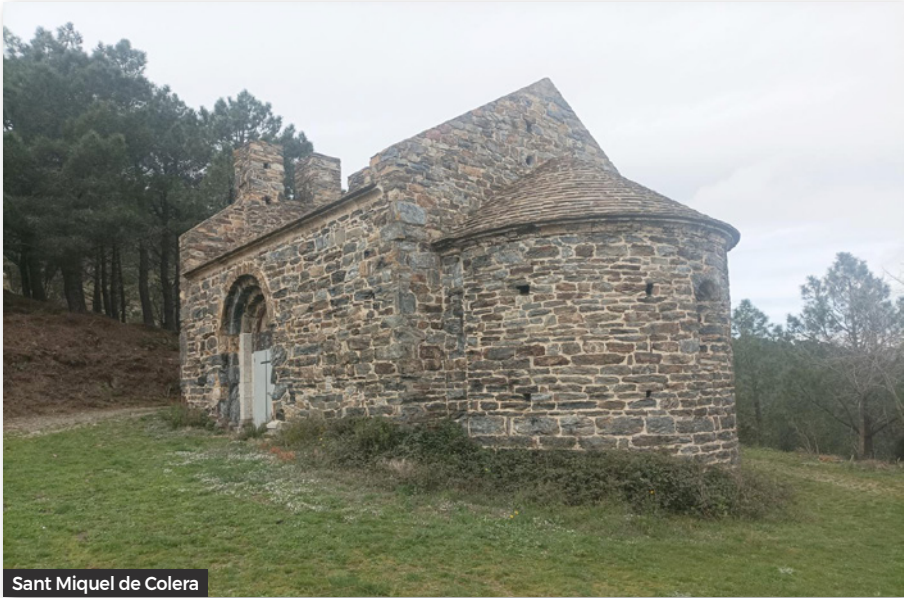
Sant Miquel de Colera

glésia parroquial del poble de Colera , fins que aquest poble es va traslladar al costat del mar al segle XVIII.