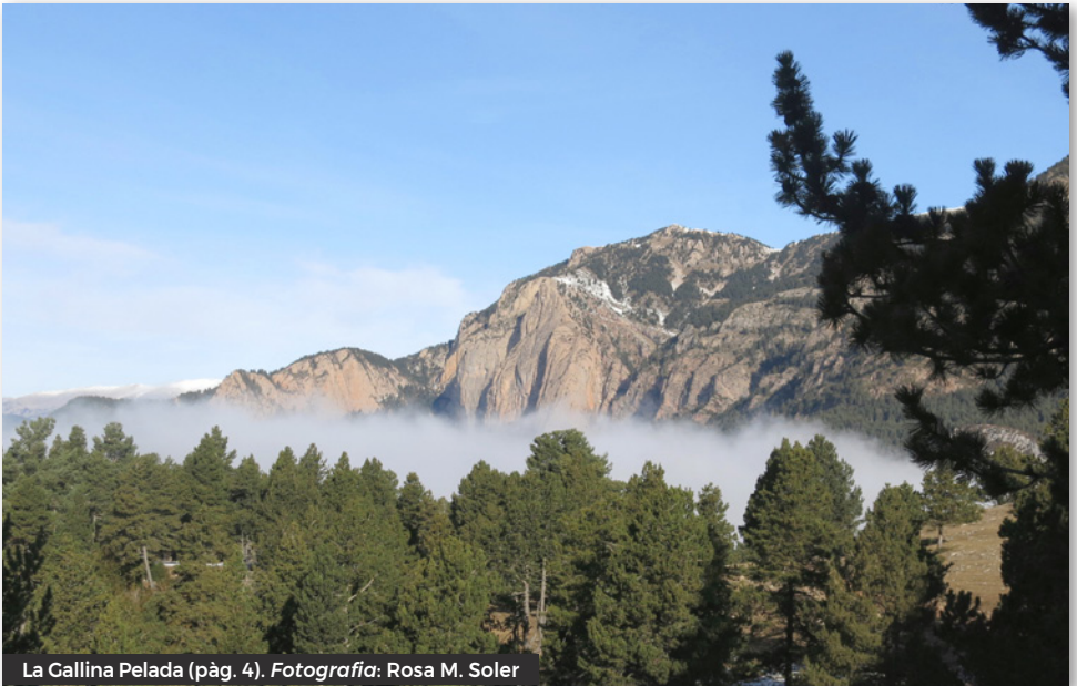
La Gallina Pelada (pàg. 4).